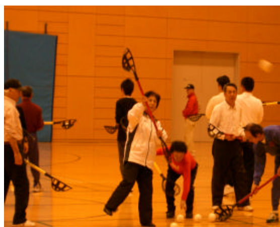
県レク南ブロック連絡協議会ニュースポーツ実技講習会にて(1月26日)

編集・発行 さいたま市レクリエーション協会 http://saitamashi-rec.cool.ne.jp